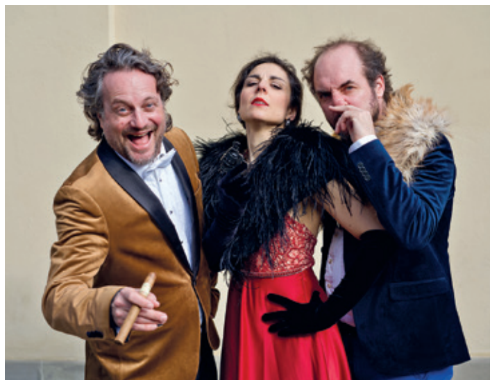
Die «Operetta Ardez» bringt «The Bear» nach Arosa.