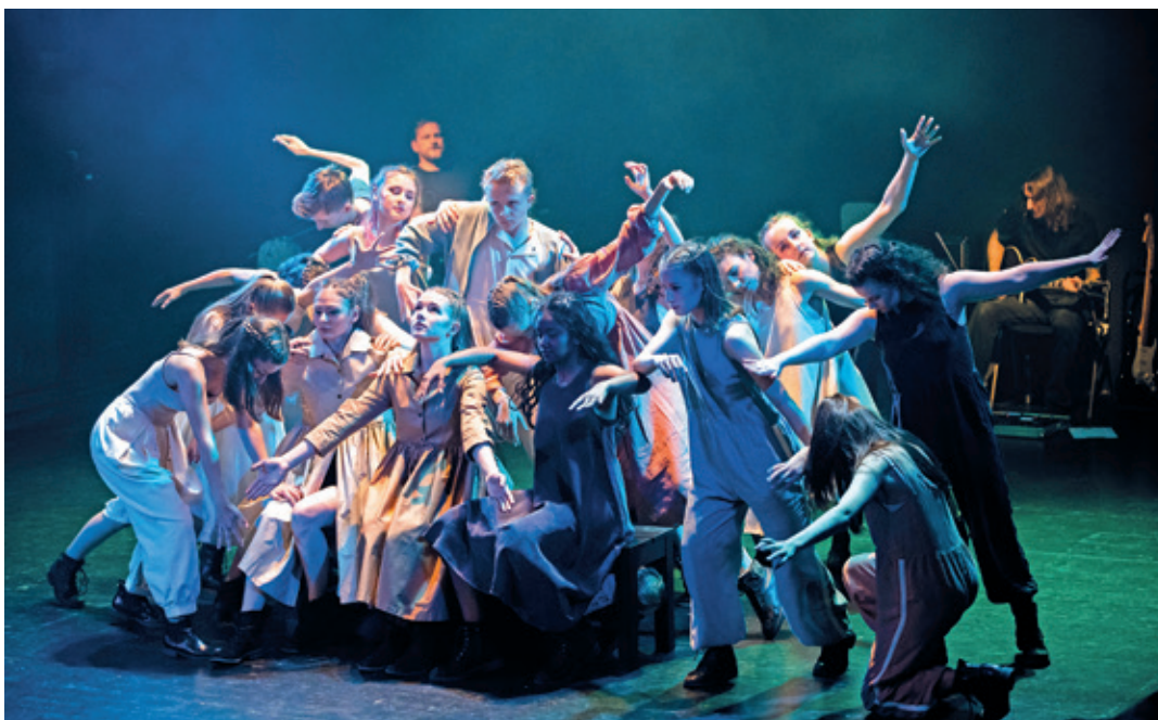
Im Juni tanzen die Schülerinnen und Schüler von Tanzerina wieder im Theater Chur.