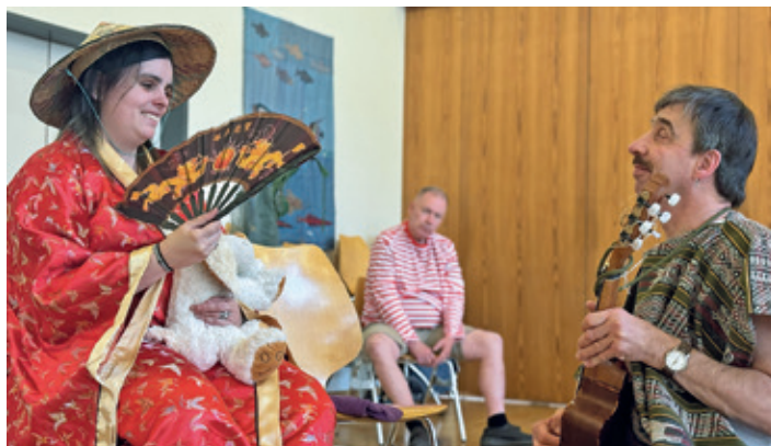
Proben zum neuen MiMe-Stück zum Thema Ferien.

Das Theater MiMe präsentiert in seinem neuesten Stück einen lustvoll-bissigen Blick auf Ferien im Zeitalter der Künstlichen Intelligenz. In «Stockwerk unbekannt» nimmt das Ensemble des Theater MiMe das Publikum mit auf eine ebenso humorvolle wie nachdenkliche Reise durch die digitalisierte Ferienwelt. Zwischen Wunsch und Wirklichkeit, Komfort und Kontrollverlust entfaltet sich eine Geschichte voller Überraschungen.