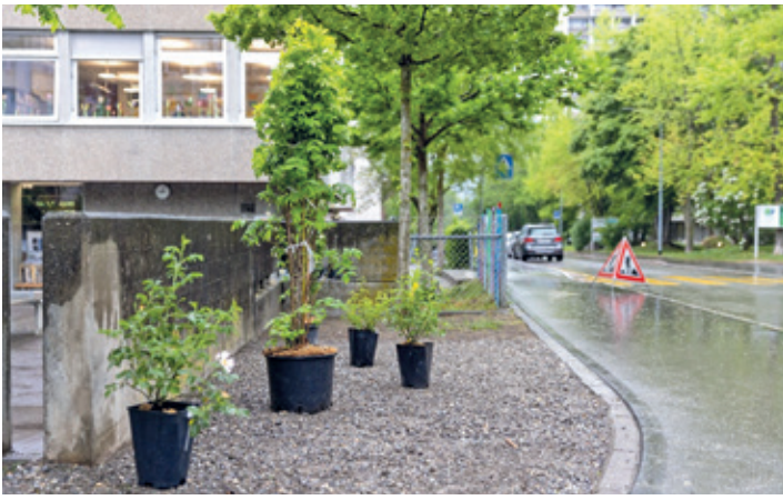
Vorbereiteter Boden und Pflanzen der Stadtgärtnerei