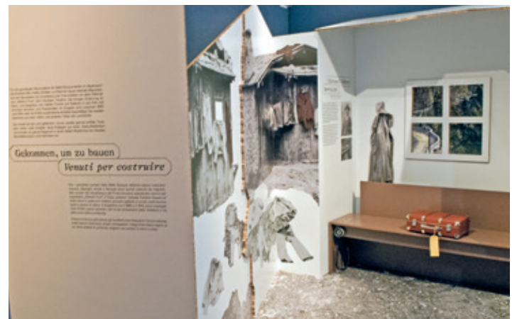
Ein Koffer wartet auf Kinderhände.