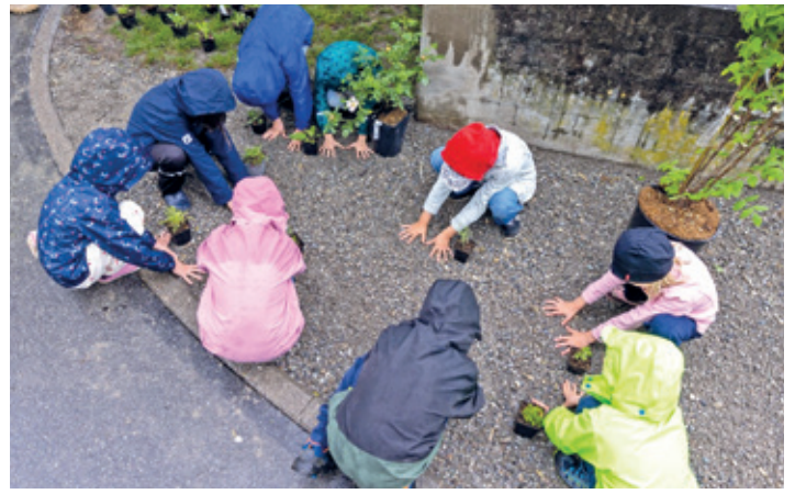
Die Pflanzen müssen mit genügend Abstand verteilt werden.