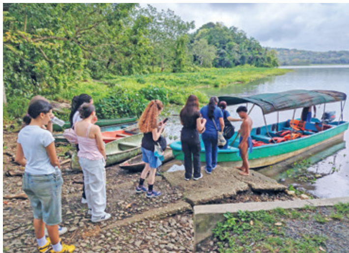
Das Dorf im Dschungel «Wounaan San Antonio» ist nur per Bootsfahrt erreichbar.