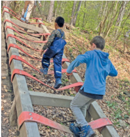
Freizeitaktivitäten im Wald.

Ein wichtiges Thema in diesem Jahr ist die Einführung eines Mitsprachegremiums der Kinder. Die Umsetzung dieses Legislaturzieles startet nach den Frühlingferien. Mit diesem Projekt stärken wir einerseits die Selbstwirksamkeit der Kinder und andererseits ist es eine Herausforderung als Team und mit den Kindern konstruktive Veränderungen einzuführen.