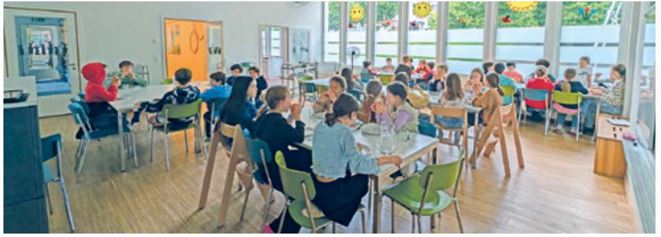
Blick in den Essbereich.

In der KTS Montalin werden pro Tag durchschnittlich 60 Kinder über Mittag betreut. Die Kinder ab der ersten Klasse können den Zeitpunkt des Mittagessens selbst bestimmen. Das Konzept Open Restaurant wird in allen grösseren Standorten der schulischen Tagestrukturen angewandt. Die Kinder, die noch im Kindergarten sind, werden beim Mittagessen begleitet. Vor und nach dem Mittagessen können die Kinder entscheiden zwischen Bewegung, Konstruktion, Zeichnen und anderen Dingen. Viele Kinder basteln für ihr Leben gerne und sind sehr kreativ in ihrem Prozess diverse Materialien zu verarbeiten. Ebenfalls ist der Bewegungsraum ein sehr beliebter Aufenthaltsort der meisten Kinder. Andere Möglichkeiten, um sich zurückzuziehen, sind zum Einen der Ruheraum und das Rollenspielzimmer. Bei trockenem Wetter nutzen viele Kinder die Spielmöglichkeiten draussen.