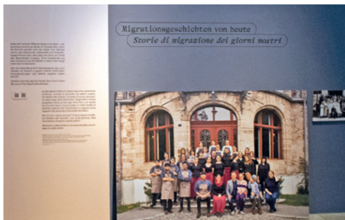
Hotelpersonal mit internationalem Hintergrund.

Für jede dieser Geschichten ist eine Kulisse erstellt worden, aus Karton. Gut zu transportieren, da