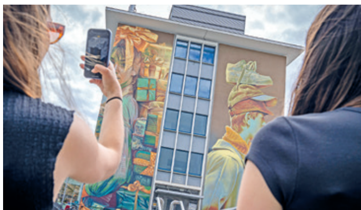
Das Wand Festival bringt neue Murals an die Wände.

Am Wand Festival wird die urbane Kunst und Kultur mit Führungen, Workshops, Talks, Battles, Musik, Breaking und vielem mehr gefeiert. Die ersten Artists beginnen bereits zwei Wochen