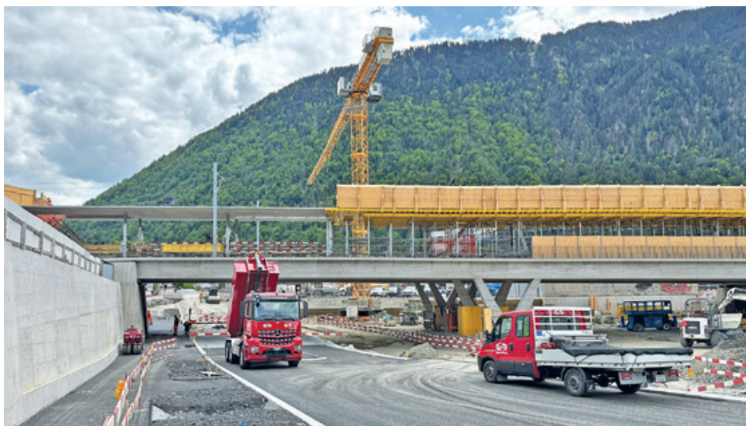
Über den Sommer werden die Bauarbeiten noch weiter laufen.

Details zu den laufenden Arbeiten, aber auch Einblicke in die Baustelle gibt es auf www.churwest.ch