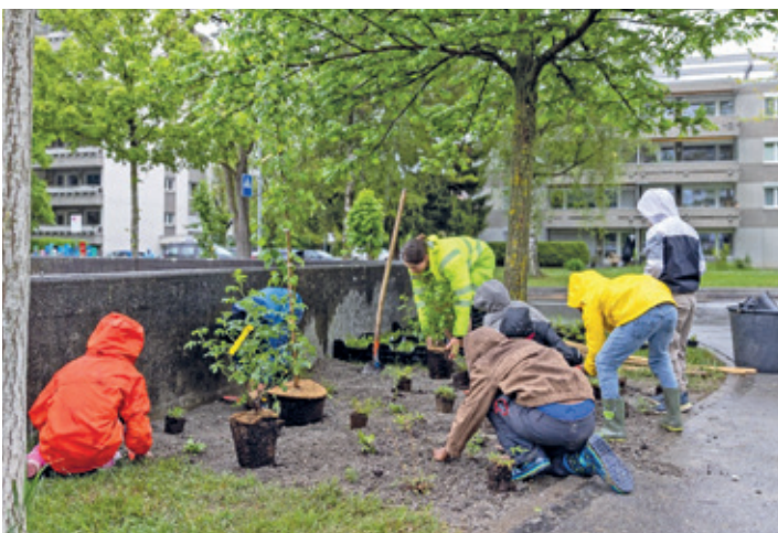
Unter Anleitung der Stadtgärtnerin arbeiten alle motiviert mit.

Im Herbst sollen dann neue Bäume gepflanzt werden, Igelhaufen und Sandlinsen für Wildbienen entstehen. So kommen wir unserem Ziel, mehr Biodiversität auf unserem Schulhausareal vorzufinden und klimafit zu werden, einen Schritt näher. Wir bleiben dran! MC und RR