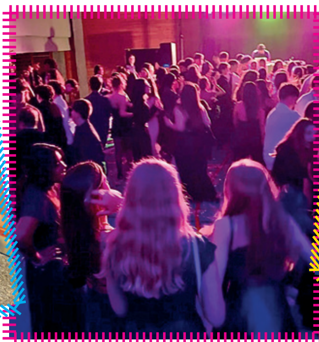
Die Party in vollem Gange.