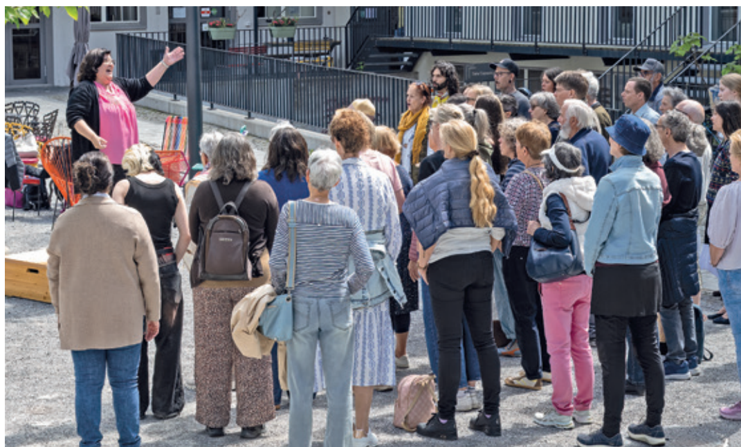
Rund 45 Leute sind zu «Chur jodelt!» erschienen.