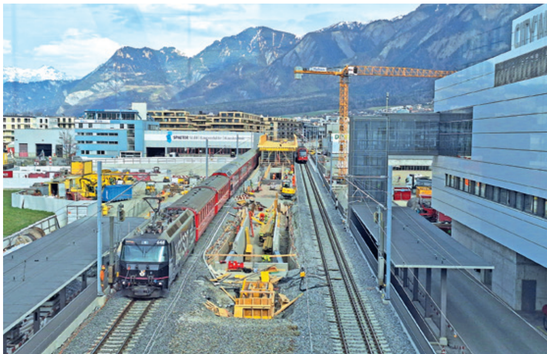
Die Bauarbeiten am neuen Bahnhof Chur West laufen auf Hochtouren und nähern sich dem Ende.

Parallel dazu wird das Umfeld des Bahnhofs gestaltet: die Raschärenstrasse, die neuen Haltestellen für Bus und Postauto