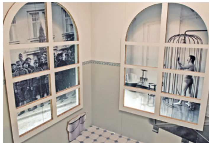
Eine Geschichte zum Bädertourismus in Meran.

Nach dem 1. Weltkrieg verändert sich die Lage in den Tourismusgebieten grundlegend. Viele Stammgäste bleiben aus, die Migrationsrouten brechen ab. Doch dann entstehen neue Anziehungspunkte für Touristinnen und Touristen. Und so gibt es bis heute an all diesen Orten einen grossen Bedarf an Arbeitskräften. Die Geschichten dieser Menschen bleiben wohl im verborgenen, wie auch die von den Protagonistinnen und Protagonisten der aktuellen Sonderausstellung es geblieben wären, hätten die Ausstellungsmacherinnen sie nicht ausgegraben und für diese Ausstellung mit all dem Material, das sie über die Personen finden konnten, stellvertretend für alle anderen Arbeitsmigranten zusammengestellt.