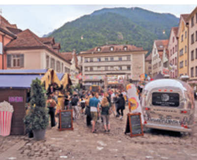
Kinogenuss am Kornplatz. (zVg)

Vom 11. bis 21. Juni verwandelt sich der Kornplatz erneut in ein stimmungsvolles Open-Air-Kino. Mit der fünften Ausgabe des Open-Air-Kinos kinoa entsteht