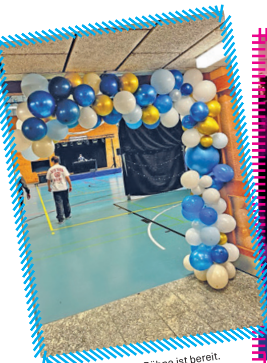
Der Tanzsaal mit DJ Bühne ist bereit.

Für alle gabs einen gratis Willkommens-Drink.