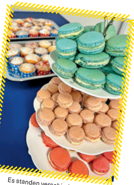
Es standen verschiedene, selbstgemachte Desserts zur Auswahl.