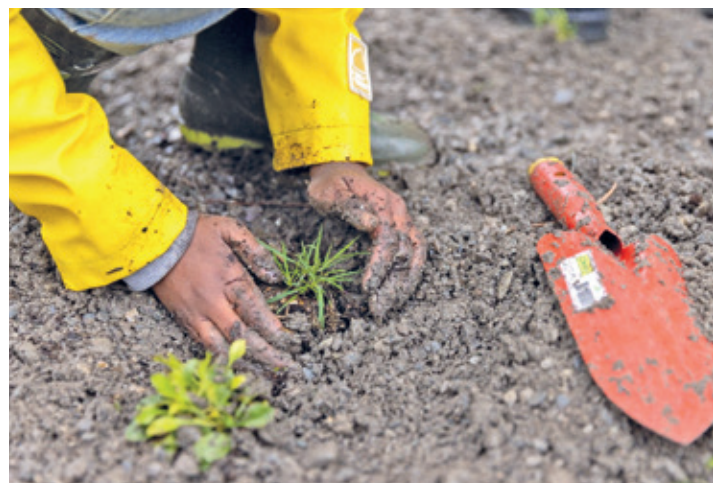
Die Pflanzen werden vorsichtig eingegraben.