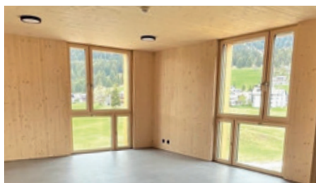
Einer der neuen Schlafräume.

Dank dem Einsatz und Engagement der Stadtschule Chur, der Stiftung Churer Ferienkolonie und der Stadt Chur lebt die Churer Ferienkolonie nicht nur in der Erinnerung an alte Zeiten, sondern schreitet trotz ihres beachtlichen Alters zuversichtlich in die Zukunft.