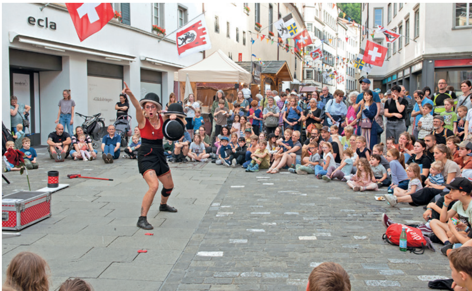
Stauende und lachende Gesichter am Buskers: Die Strassenkünstlerinnen und -künstler locken viel Publikum in die Altstadt.

Gastronomie: 12–24 Uhr Programm: 13–23.45 Uhr