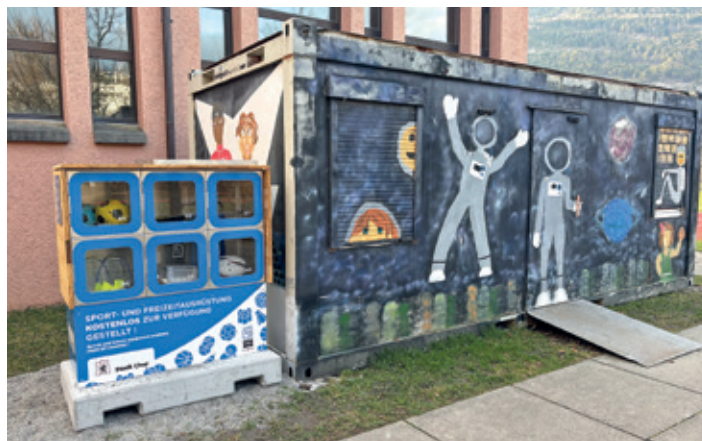
In der BoxUp-Station befinden sich Sport- und Freizeitgeräte.

Basierend auf einer Befragung aller Churer Jugendlichen im Jahr 2022 verabschiedete der Churer Stadtrat 2024 den Massnahmenplan Suchtprävention. Die fehlende Bindung von Jugendlichen zu ihrer Wohngegend wurde darin als Risikofaktor priorisiert. Als eine Massnahme wurde die Verbreitung des Angebots «BoxUp» auf alle drei Standorte der Sekundarschulhäuser definiert. Mit der Inbetriebnahme des Standortes Giacometti ist diese Massnahme nun vollständig umgesetzt. BoxUp-Stationen stehen Jugendlichen und der übrigen Bevölkerung seit 2023 auf der Quaderwiese und seit 2025 bei der Schul- und Sportanlage Fortuna zur Verfügung. «BoxUp» ist eine Sharing-Lösung für frei zugängliche Sport- und Freizeitgeräte. Über eine App können verschiedene Geräte kostenlos