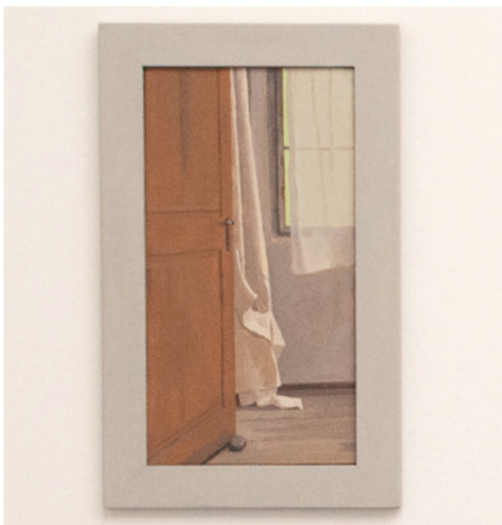
Derselbe Blickwinkel auf die offene Tür und das Fenster der Wohnung in San Carlo, zu unterschiedlichen Zeiten.