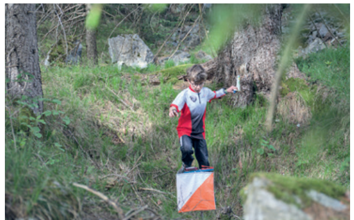
Am 2. Mai ist OL-Schnuppern möglich.