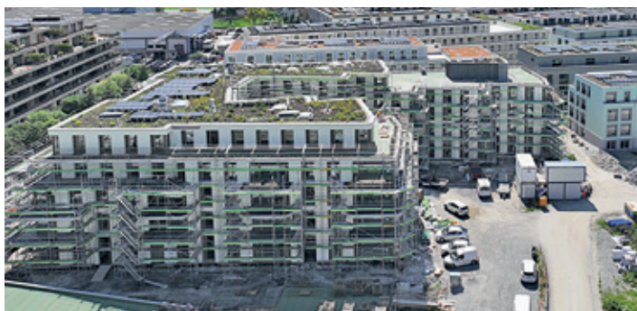
Das neue Quartier wird von einer Energiezentrale versorgt.

Von der Energiezentrale aus gelangt die Wärme über ein rund 550 Meter langes Leitungsnetz