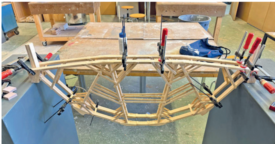
Diese Brücke hat ein Gewicht von 1,6 Tonnen getragen.

In einem ersten Schritt entwickelte das Team die Konstruktion am Computer. Auf dieser Basis entstand das Modell aus den vorgegebenen Materialien. «Wir legten unseren Fokus bewusst auf das statische System mit dem Ziel, eine möglichst hohe Traglast zu