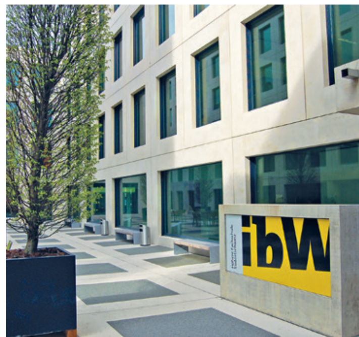
Die ibW informiert online über Weiterbildungen.

im Erwachsenenbildungsbereich tätig. Im Herbst 2026 starten an den ibW-Standorten zahlreiche neue Lehrgänge. Der Online-Infoabend am Donnerstag, 28. Mai, bietet die ideale Gelegenheit, sich über passende Optionen zu informieren. Egal, ob