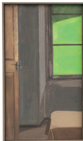
Interieur San Carlo im Puschlav.