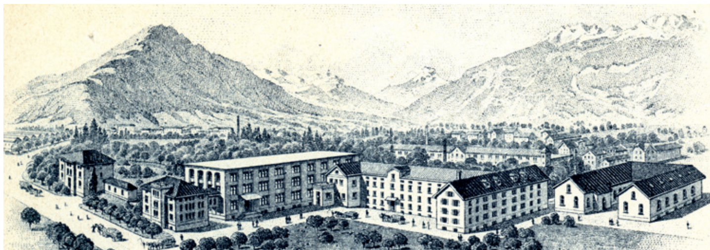
Ein Stich der alten Schoggifabrik in Chur.