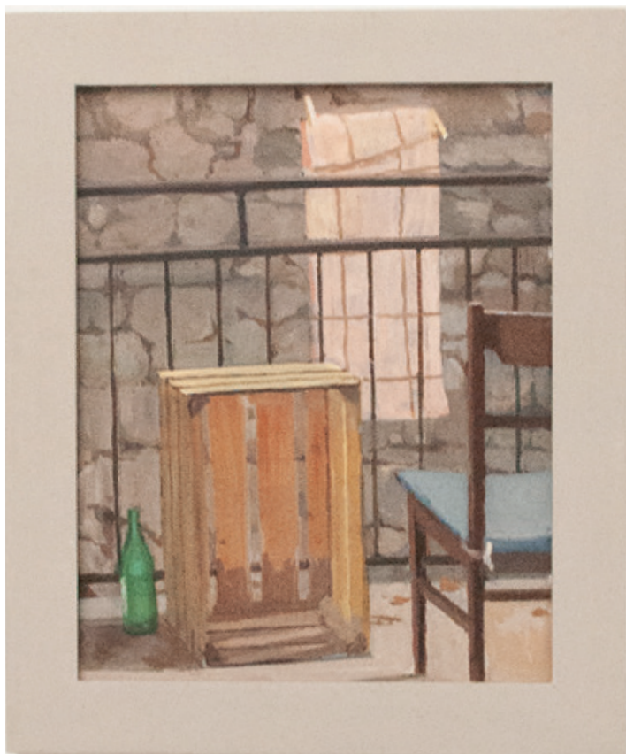
Der Balkon in San Rocco im Veltlin.

nige wenige Aquarelle sind in einem der fünf Ausstellungsräume zu sehen. Kielholz hat immer seine Umgebung und insbesondere auch alltägliche Details darin festgehalten. Sowohl auf sei-