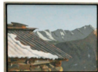
Nachbarsdach in San Rocco.