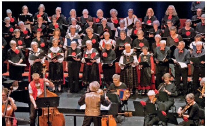
Der Seniorenchor bei einem Auftritt.

Der gemischte Bündner Seniorenchor CANZIANO! ist eine Erfolgsgeschichte. 2009 auf Initiative von Pro Senectute ins Leben gerufen, tritt der Chor mit den rund 80 Sängerinnen und Sängern seither in den Talschaften Graubündens und an verschiedenen Orten in der Schweiz auf, des Öfteren ge-