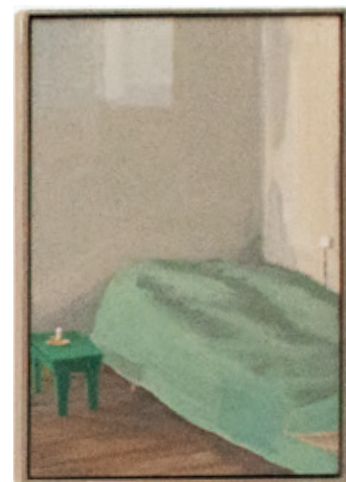
Bett mit Schemel.