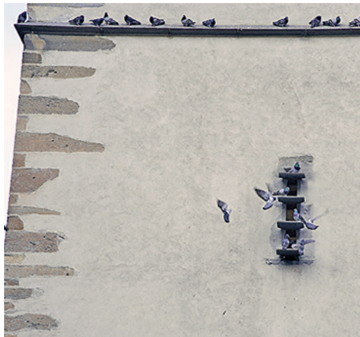
Der Eingang zum Taubenschlag im Martinsturm.

Die scheinbare Widersprüchlichkeit löst sich damit auf: Der städtische Werkbetrieb verfolgt ein bewusstes Lenkungssystem. Während am Bahnhofplatz ein Fütterungsverbot gilt und punktuell gereinigt wird, bündelt der Taubenschlag in der Altstadt die Population gezielt. Die Tiere im Martinsturm bilden dabei weitgehend eine eigene Gruppe – sie sind nicht identisch mit den Tauben am Bahnhof, wie es in einer Mitteilung heisst.