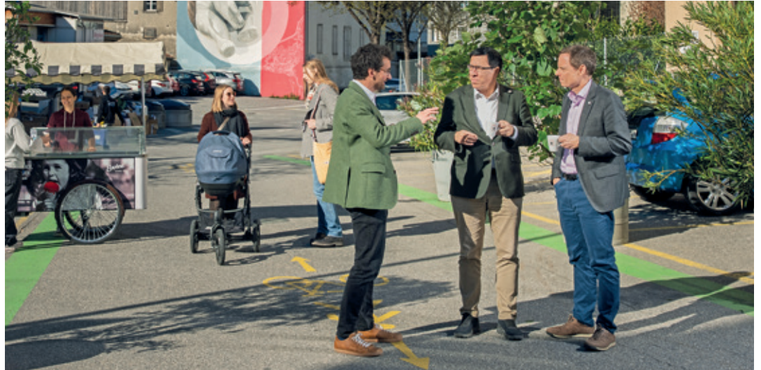
Es bewegt sich etwas: Der Westweg zwischen Italienischer Brücke und Chur West wird zur Fussgängerzone. So ist es zumindest im Entwurf der Planung vorgesehen.

Die Grundordnung besteht aus mehreren Teilen: dem Baugesetz, dem Zonenplan sowie dem generellen Gestaltungs- und dem generellen Erschliessungsplan. Durch die Fusion der Stadt Chur mit den Ortsteilen Maladers (2020), Haldenstein (2021), Tschierschen und Praden (2025) gibt es aktuell mehrere Baugesetze und unterschiedliche planerische Grundlagen. Mit der Revision werden diese Grundlagen vereinheitlicht und zusammengeführt. Gleichzeitig wird die Grundordnung an die heutigen Anforderungen angepasst, indem die Stadt die Vorgaben von Bund und Kanton umsetzt. Für die Bevölkerung bedeutet dies vor allem eines: mehr Klar-