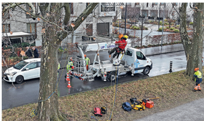
Erfahrene Baumpfleger führen die Einsätze an den Stadtbäumen durch.

Ziel der Pflege ist es, Totholz zu entfernen und einzelne Äste gezielt zu entlasten, um Astbrüche zu verhindern und die Sicherheit