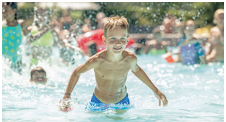
Badespass im Freibad Obere Au, Chur.