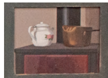
Die Teekanne auf dem Ofen.

Nun zeigt er in Chur viele Blicke auf das karge Interieur seiner Wohnungen, und einige Ausblicke auf Nachbarsdächer, Landschaftsausschnitte. Am auffälligsten sind die beiden Gebirgslandschaften mit schneebedeckten Gipfeln und Kondensstreifen am blauen Himmel, auf der Rückseite der Stellwand, die den ersten Raum teilt. Ihre Form springt aus der Reihe, sie ist einem Rundbogenfenster nachempfunden und die beiden Bilder strahlen hell inmitten der vielen Bilder aus dem Innern der schattigen Wohnungen, in denen der Künstler zu leben scheint.