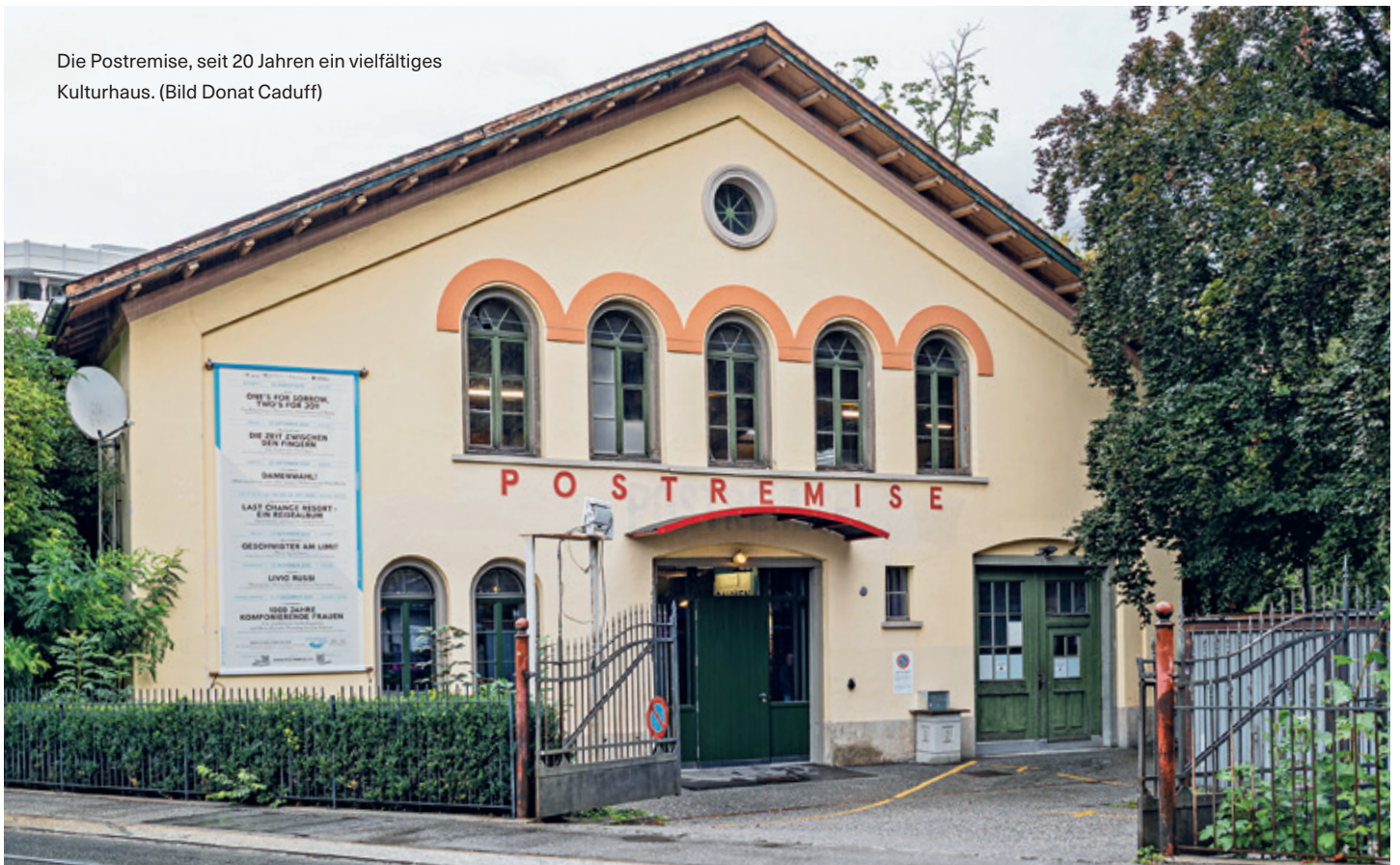
Die Postremise, seit 20 Jahren ein vielfältiges Kulturhaus.

Mit dem Umbau im Jahr 2013 sind die Voraussetzungen dafür gesetzt worden. Das Gebäude wird vorzu weiter verbessert. Es steht noch einiges an, nicht nur um den Status quo zu erhalten, sondern auch um das Haus auszubauen. «Es gibt seit über zwölf Jahren einen pfeifenfertigen dreistufigen Umbauplan», erklärt Ferrari. Girschweiler sagt: