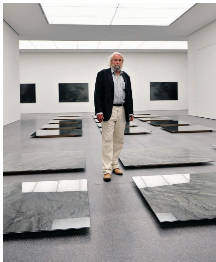
Vier Jahrzehnte Fotografie: Hans Danuser zwischen den Bildtafeln der Werkgruppe «Erosion I–III».

«Dunkelkammern der Fotografie» – so lautet der Titel der ersten Einzelausstellung von Hans Danuser im Bündner Kunstmuseum seit fast 25 Jahren. Die Ausstellung, die noch bis zum 20. August im zweiten Untergeschoss des Erweiterungsbaus und im Kabinett der Villa Planta untergebracht ist, umfasst ein Dutzend Werkgruppen, die mit ganz wenigen Ausnahmen alle über mehrere Jahre entstanden sind. Die ersten Bilder, «Fisch III und IV»,