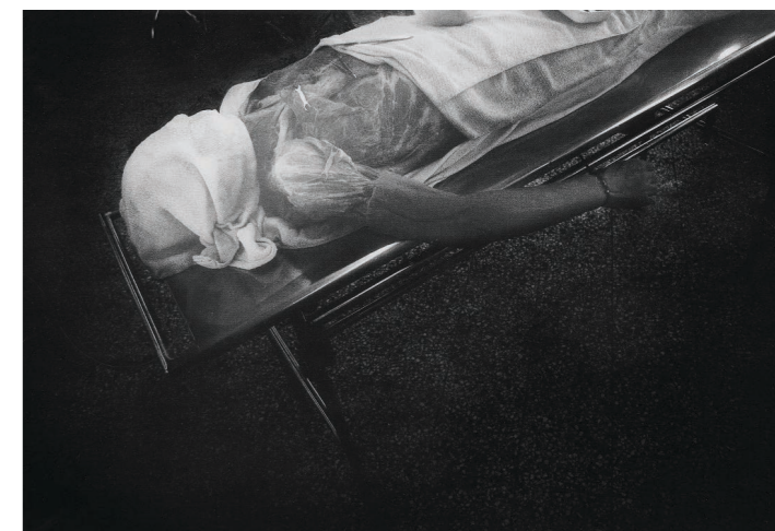
«Medizin I», aus dem Zyklus «In Vivo» (1980–1989).