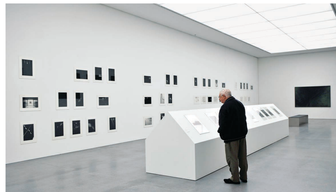
Verstörende Bildwelten: Blick in die Ausstellung «Dunkelkammern der Fotografie».