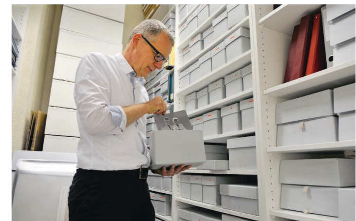
Umfangreicher Bestand: Das Stadtarchiv verfügt über zirka 50 000 Fotos.