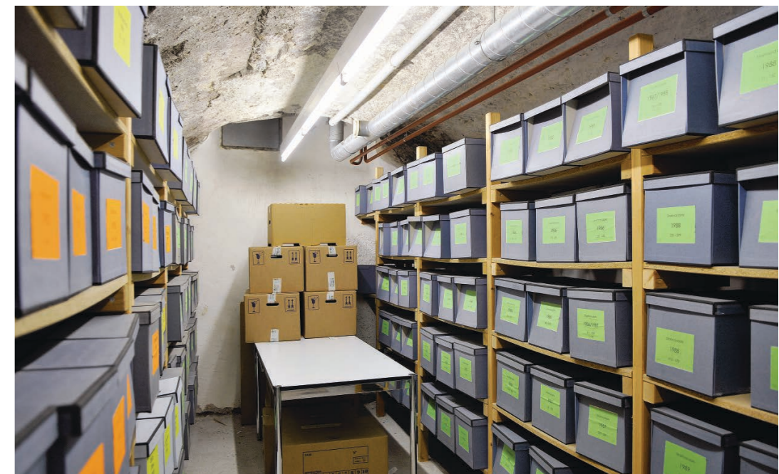
Ungeeignete Räume: Blick in ein Magazin des Stadtarchivs im Keller des Rathauses.

Ulf Wendler hat die Aufsicht über Schriftgut von mehr als 1000 Jahren. In den Räumen an der Poststrasse stehen 2000 Regalmeter zur Verfügung, die längst mit Akten der städtischen Verwaltung und der Region Plessur gefüllt sind. Und es wären noch mehr, wäre die Stadt Chur im 15.